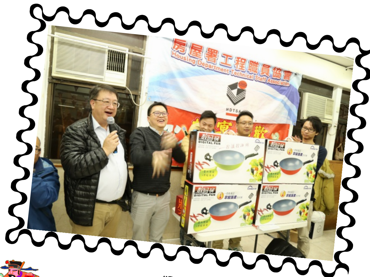
獎品豐富，皆大歡喜！

本人想在此多謝工會各幹事義務地抽空為我們每年提供不少精彩活動及爭取福利。希望工會日後仍像今次蛇宴一樣，大膽創新。