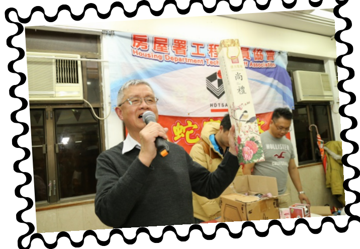
珠哥身壯力健， 中氣十足！