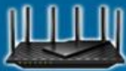
TP-Link Archer AX72 Pro